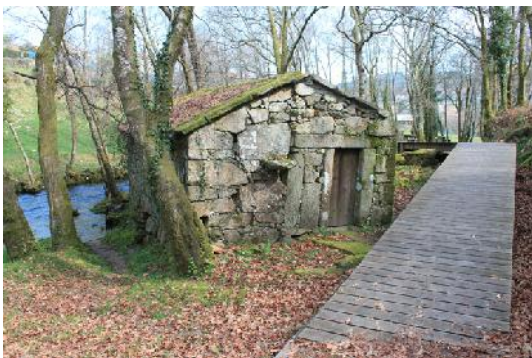
Senda fluvial do río Alfofrei, desnivel