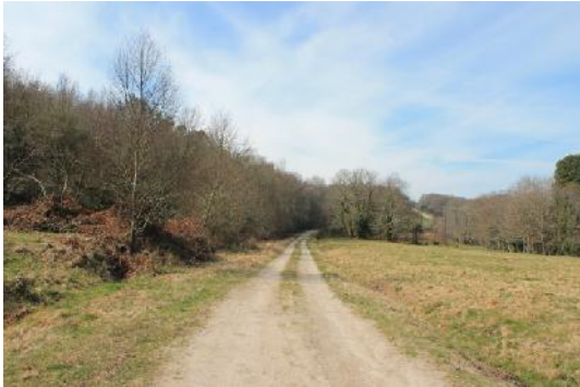
Senda cara ao Pozo Negro