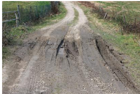
Remate da zona cómoda

O Concello de Cotobade sitúase na estrada PO-233, km 12,5. Case fronte á Casa do Concello, hai un desvío coas indicacións Pozo Negro 2, Rebordelo 1,5. Sobre este indicador hai tres placas de lugares de interese: San Martiño de Rebordelo, San Brais e Praia Fluvial.