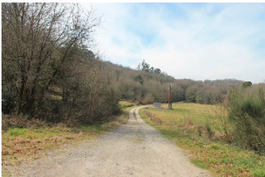
Senda cara ao Pozo Negro