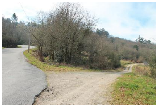
Senda cara ao Pozo Negro, inicio