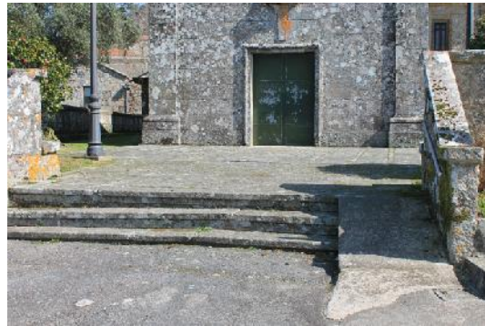
Acceso á igrexa