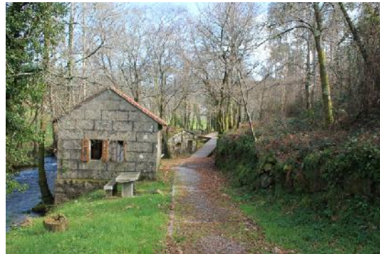
Senda fluvial do río Alfofrei, muíño