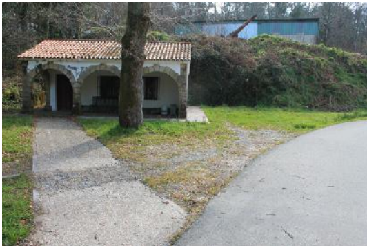
Senda fluvial do río Alfofrei, inicio