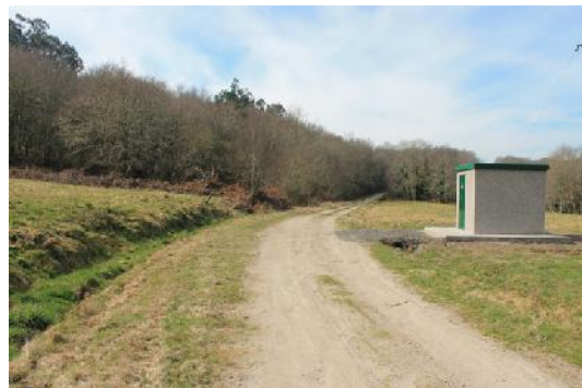
Senda cara ao Pozo Negro