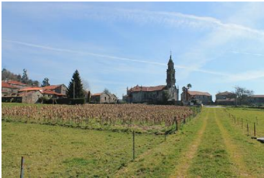
Camiño e vista xeral da aldea